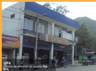
UF4 Oficina de atención al usuario fija Irra.