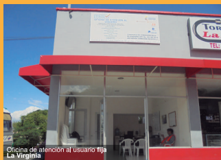
Oficina de atención al usuario fija La Virginia