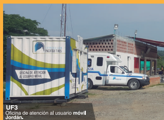
UF3 Oficina de atención al usuario móvil Jordán.