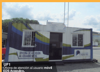
UF1 Oficina de atención al usuario móvil EDS Acapulco.