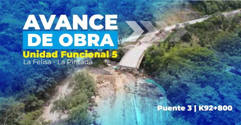
Puente 3 | K92+800