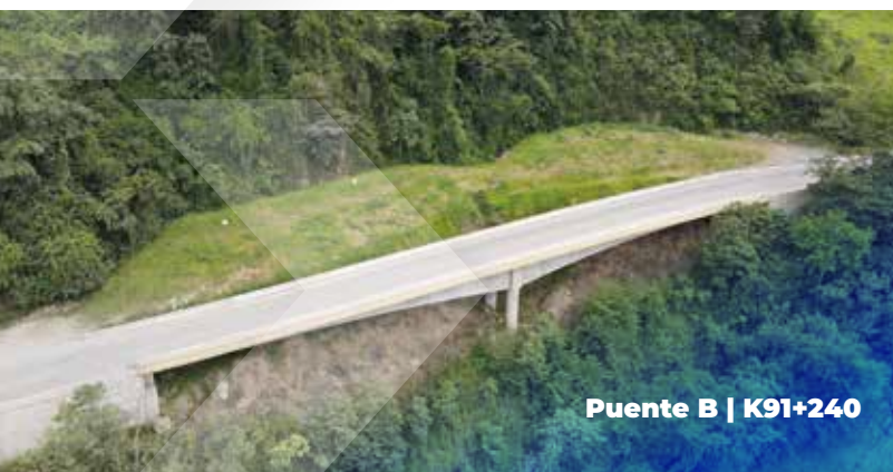
Puente B | K91+240