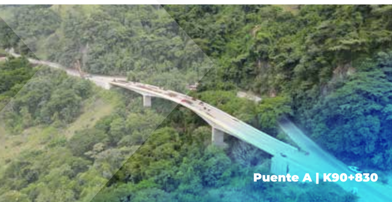
Puente A | K90+830