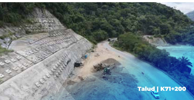
Talud | K71+200