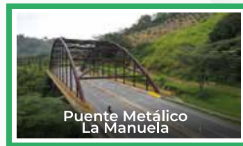
Puente Metálico La Manuela