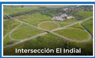
Intersección El Indial

Conoce el estado de las obras de nuestro proyecto, con corte al mes de abril de 2023.