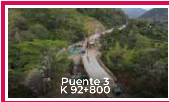
Puente 3 K 92+800