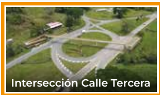
Intersección Calle Tercera