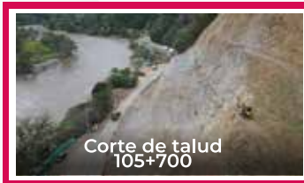
Corte de talud 105+700