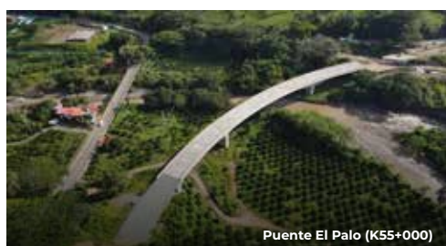
Puente El Palo (K55+000)