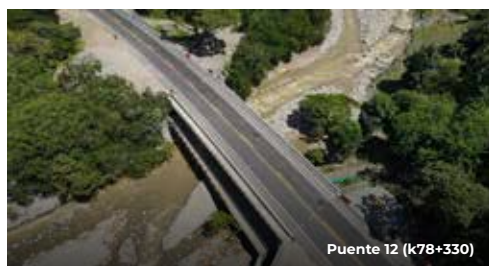
Puente 12 (K78+330)