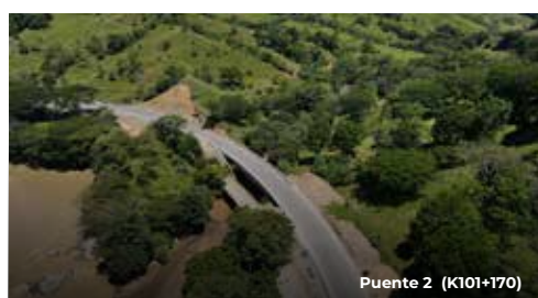
Puente 2 (K101+170)

A través del siguiente código QR podrás visualizar el video de avance de obra del proyecto Autopistas Conexión Pacífico Tres, con corte a julio de 2022.