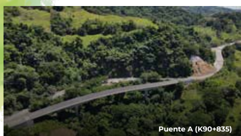
Puente A (K90+835)