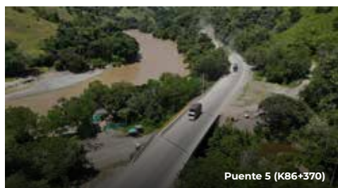
Puente 5 (K86+370)