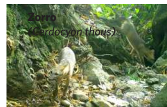
Zorro ( Sciardocyon thous )