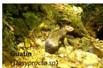
Guafín ( Dasyprocta sp. )

Osos hormigueros, tairas, zorros y perros de monte.