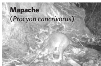
Mapache ( Procyon cancrivorus )