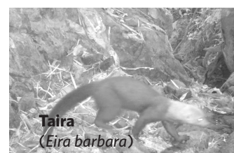
Taira ( Eira barbara )