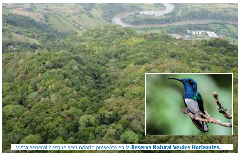
Vista general bosque secundario presente en la Reserva Natural Verdes Horizontes .

Dicha área se encuentra inscrita en la Asociación Red Colombiana de Reservas Naturales de la Sociedad Civil desde hace más de 10 años y cuenta con gran importancia por su aporte de servicios ecosistémicos a las zonas aledañas, como a las comunidades cercanas al río Cauca.