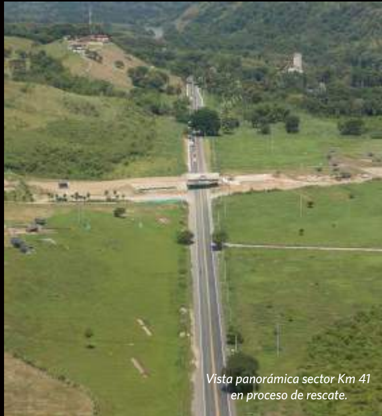
Vista panorámica sector Km 41 en proceso de rescate.

Actualmente, el único sitio arqueológico que se encuentra en proceso de avance está ubicado en la Unidad Funcional 3.1 -corregimiento Km 41 de la vereda Colombia, donde se construirá una interconexión vial para conectar con la variante y el Túnel de Tesalia.