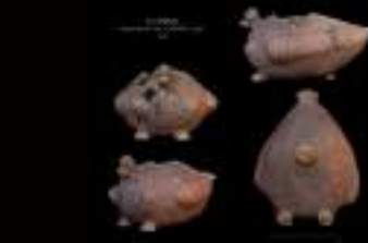
Piezas cerámicas zoomorfa (con formas de animales) recuperadas por los arqueólogos en las excavaciones arqueológicas.