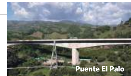
Puente El Palo