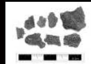
Restos de textiles.

Las evidencias recuperadas en las excavaciones arqueológicas pasan por un proceso de preparación en el que se llevan a cabo actividades diarias de limpieza, estabilización de materiales, inventarios, restauración, digitalización del registro de campo, mapas y demás insumos con los que se están realizando informes parciales para ser presentados al ICANH a medida que se avanza; esto a su vez constituye un avance en la preparación del informe final con los resultados de los estudios arqueológicos.