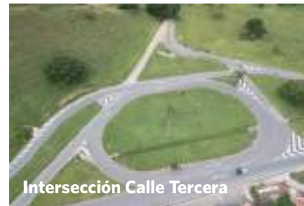
Intersección Calle Tercera