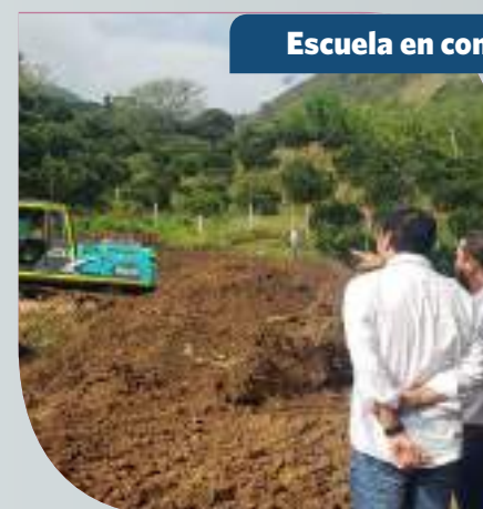
Escuela en construcción

Se espera que esté lista al finalizar el 2020, así nuestros niños tendrán un mejor lugar para aprender y estudiar.