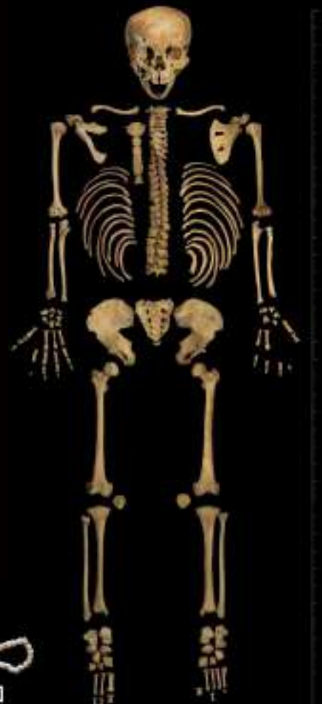
Restos óseos humanos.