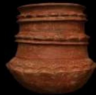
Pieza fitomorfa (con formas de plantas) recuperada por los arqueólogos en las excavaciones arqueológicas.

Para el laboratorio se contemplan 56 conjuntos o colecciones de materiales, correspondiente a los 55 polígonos intervenidos, más un conjunto de evidencias de monitoreo, entre los que se encuentran piezas cerámicas, artefactos líticos – herramientas labradas en piedra, material óseo, restos de plantas carbonizados, textiles, entre otros.