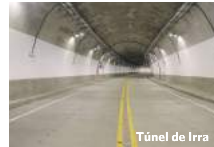
Túnel de Irra