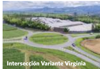
Intersección Variante Virginia