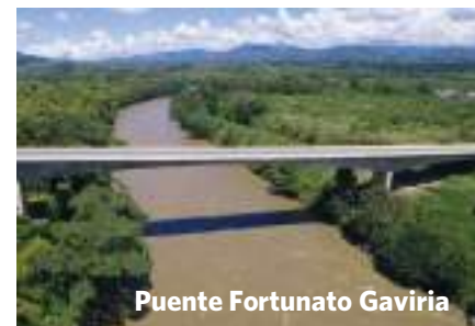
Puente Fortunato Gaviria