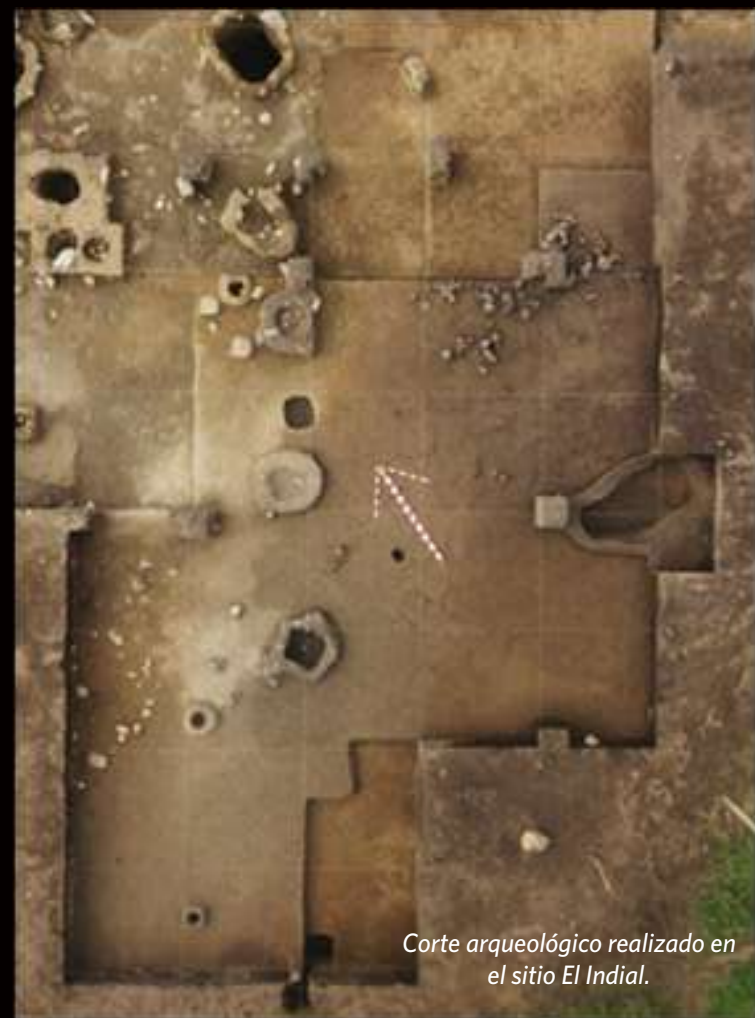
Corte arqueológico realizado en el sitio El Indial.