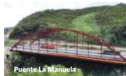
Puente La Manuela