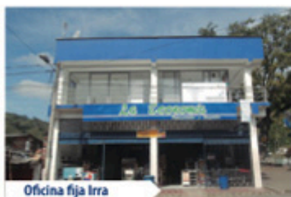
Oficina fija Irra