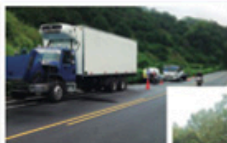
Atención carro taller

Carro Taller: 549 Grúa: 763 Ambulancia: 228