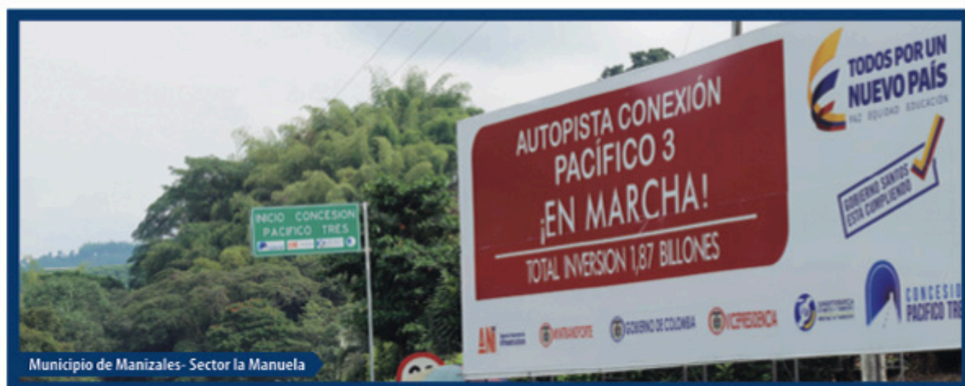
Municipio de Manizales- Sector la Manuela

Con la firma de la alianza público privada (APP) 005 de 2014 se da inicio a una de las obras de ingeniería más importantes de los últimos años en la zona, dinamizando no sólo el transporte sino también la generación de empleo, propiciando que numerosas familias tengan más fuentes de ingresos que les permitirá lograr varios de sus objetivos.