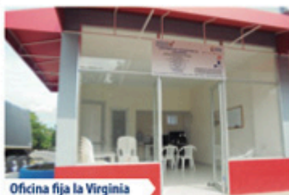
Oficina fija La Virginia

Actualmente las oficinas se encuentran dispuestas a lo largo del corredor vial, con horario de atención de lunes a viernes de 8: 00 a.m. a 12 m y de 1:00 a 6: 00 p.m. y sábados de 8: 00 am a 12 m permitiendo que los usuarios puedan acceder a la oficina más cercana y recibir atención personalizada.