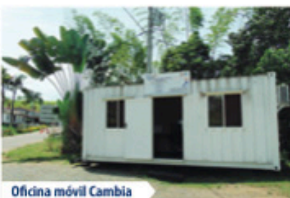
Oficina móvil Cambia