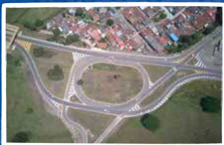
Intersección Calle 3ra