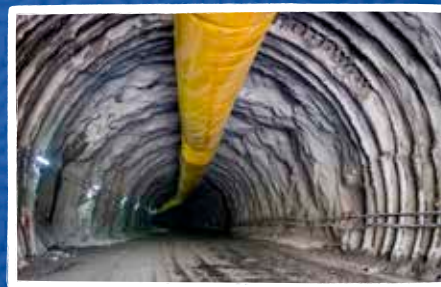
Portal Salida Túnel Irra