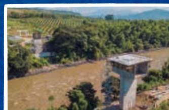
Puente Alejandría sobre el río Cauca sector KM 41