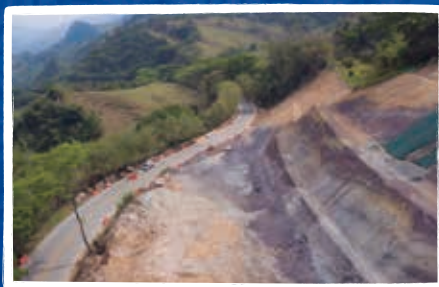
Estabilización de talud