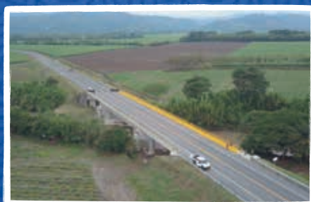
Puente sobre el río Risaralda