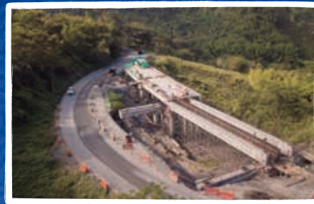
Puente 1 sector Guadalajara