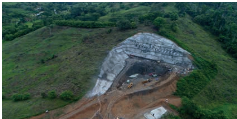
Autopista 4G Bucaramanga-Barrancabermeja-Yondó Portal salida, Túnel de la Sorda, vía La Paz-Santa Rosa-Lisboa, Santander.