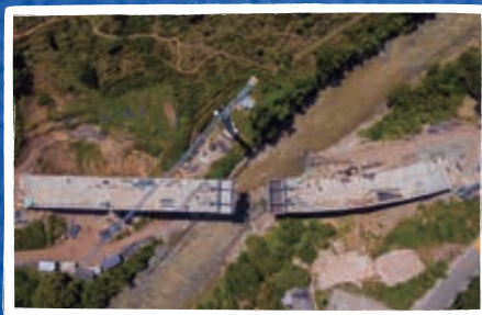
Puente sobre el río Tapias