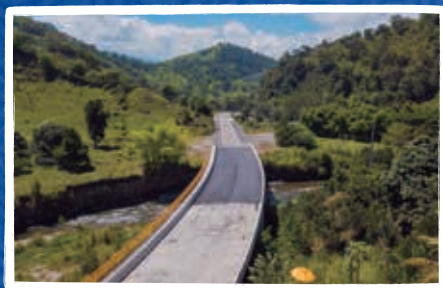
Puentes 1 y 2 sector Las Cabras