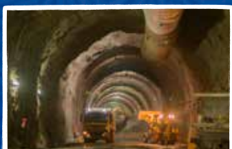
Portal entrada Túnel Tesalia