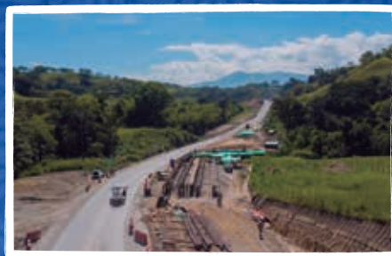
Recta La Manuela -Tres Puertas