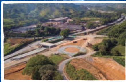
Intersección Tres Puertas