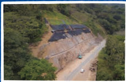
Estabilización de talud