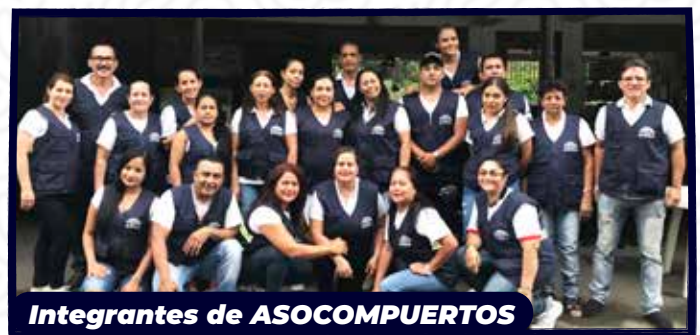
Integrantes de ASOCOMPUERTOS

Que no pierdan nunca el sentido de pertenencia, la perseverancia y que tengan claro que a pesar de los altibajos hay que ver las dificultades como retos que se pueden superar día a día, teniendo siempre lo más importante que es la bendición de Dios para que todas las cosas salgan bien.