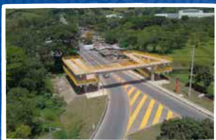
Puente peatonal Calle 3ra