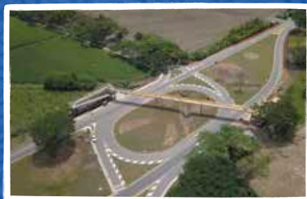
Intersección entrada a Viterbo