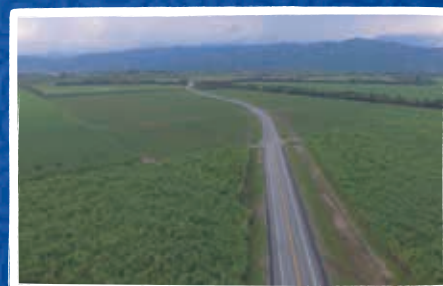
Variante La Virginia