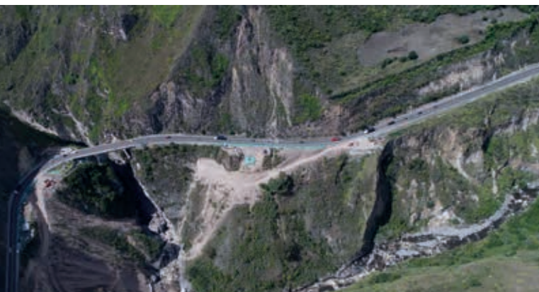
Autopista 4G Rumichaca-Pasto Construcción de puentes sobre el río Guáitara

El Caraño, primer aeropuerto con cine en el país