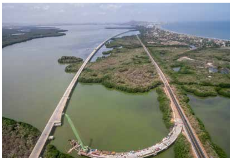
Autopista 4G Cartagena-Barranquilla y Circunvalar de la Prosperidad