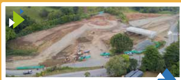
Unidad Funcional 3.1 Intersección Tres Puertas