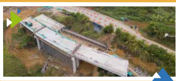
Unidad Funcional 3.2 Puente 1 Sector Guadalajara