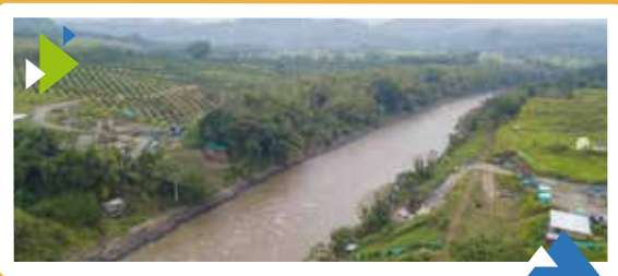
Unidad Funcional 2 Puente Alejandría