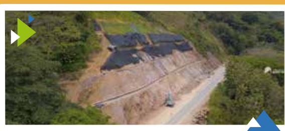
Unidad Funcional 4 Estabilización de Talud