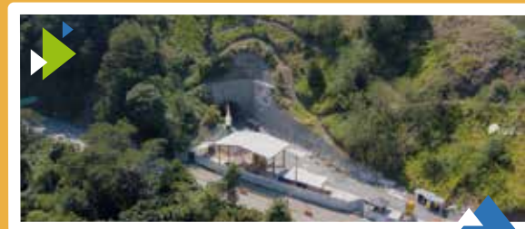
Unidad Funcional 4 Portal Salida Túnel de Irra