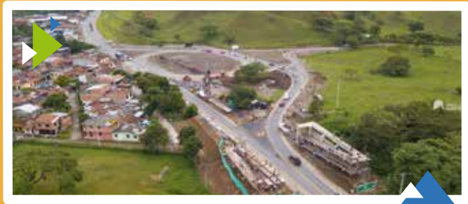
Unidad Funcional 1 Intersección Calle Tercera