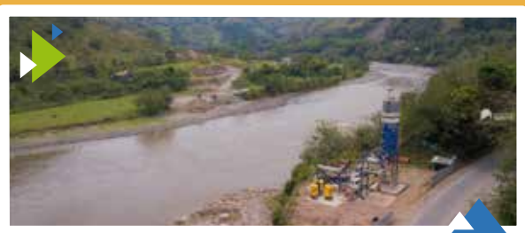
Unidad Funcional 4 Puente Cauca