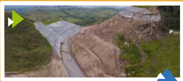
Unidad Funcional 3.1 Corte Mejoramiento