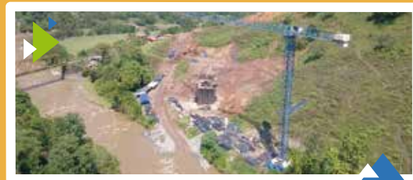
Unidad Funcional 4 Puente Tapias