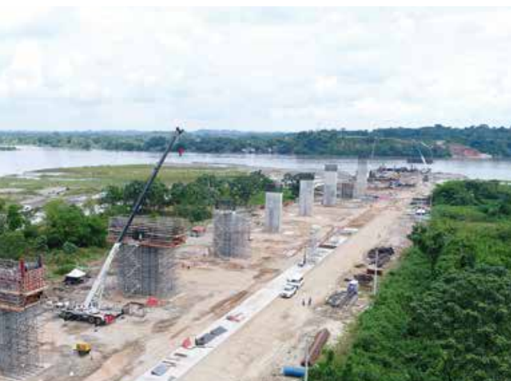
Autopista 4G al Río Magdalena 2 Remedios-Puerto Berrío (Antioquia)

Tren de prueba sobre el Corredor férreo Bogotá-Belencito