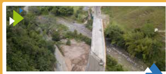
Unidad Funcional 3.1 Puentes 1 y 2 sector Las Cabras