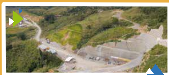
Unidad Funcional 2 Portal Entrada Túnel Tesalia