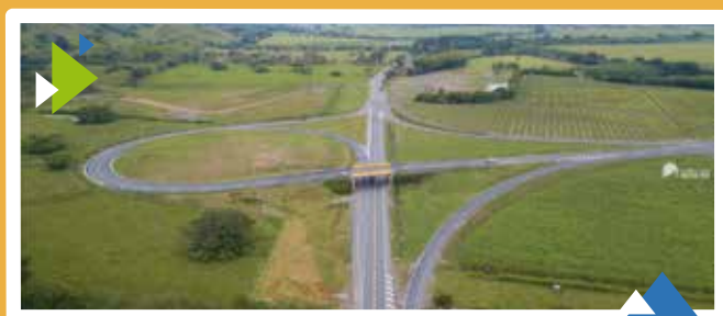
Unidad Funcional 1 Intersección Trompeta