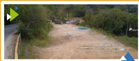
Unidad Funcional 5 Puente 3