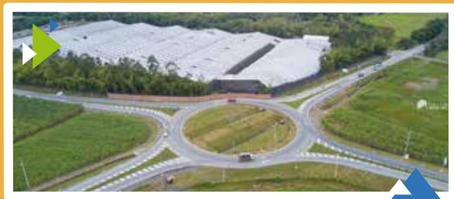
Unidad Funcional 1 Intersección Variante La Virginia