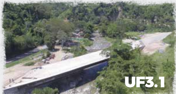
Puente 1 Sector Las Cabras

Nuestras obras siguen avanzando a toda marcha y queremos que conozcas el porcentaje de avance de cada una de las Unidades Funcionales (tramos viales) que comprenden nuestro proyecto: