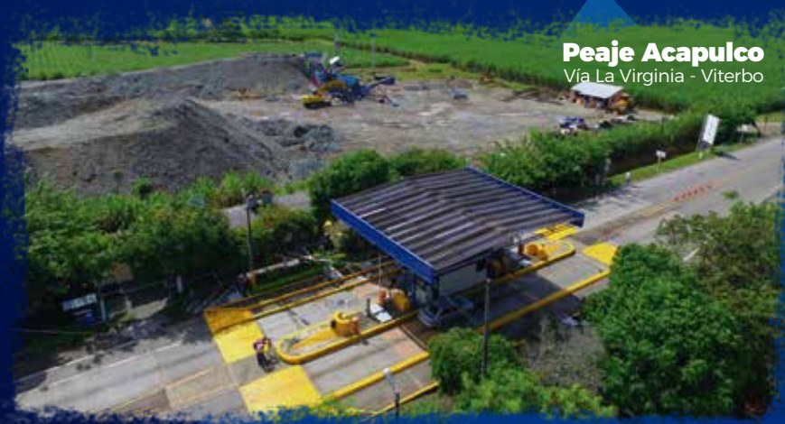
Peaje Acapulco Vía La Virginia - Viterbo