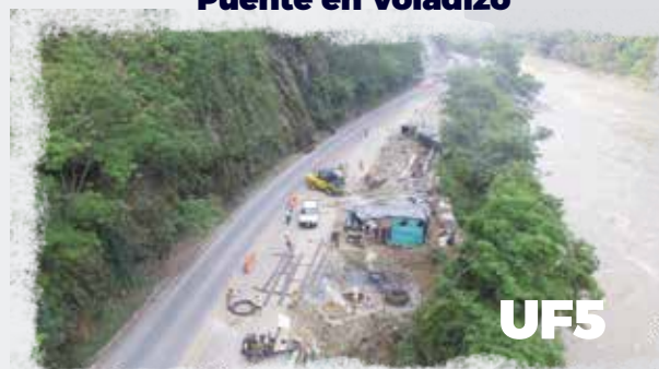
Puente en Voladizo