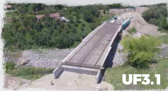
Puente 2 Sector Las Cabras