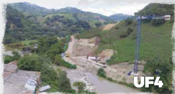
Puente sobre el río Tapias