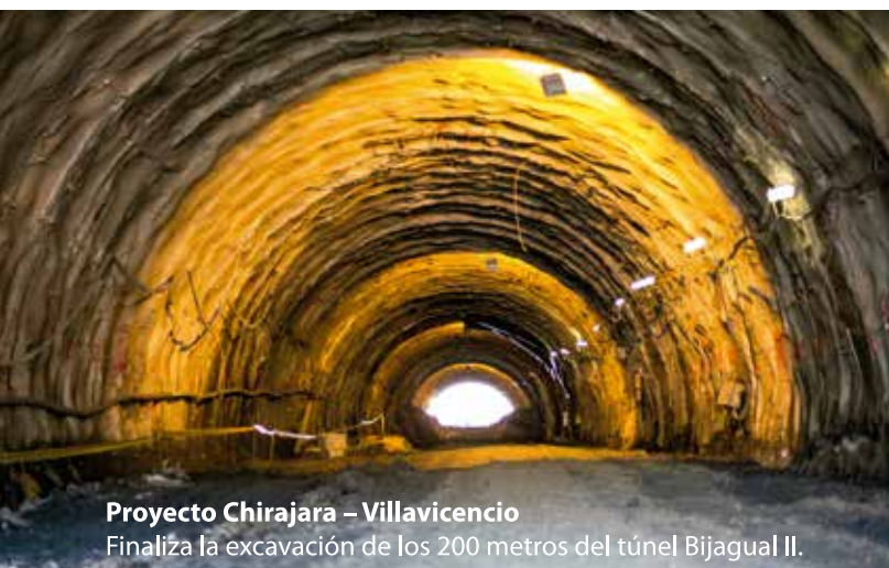
Proyecto Chirajara – Villavicencio Finaliza la excavación de los 200 metros del túnel Bijagual II.

Proyecto Girardot Honda Puerto Salgar Construcción puente intersección Flandes.