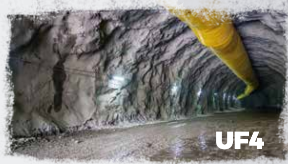
Portal Salida Túnel Irra