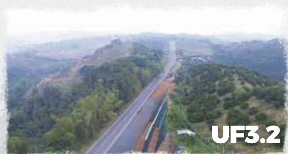
Doble Calzada sector La Manuela