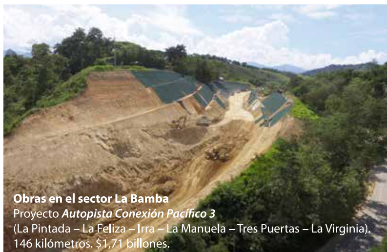
Obras en el sector La Bamba Proyecto Autopista Conexión Pacífico 3 (La Pintada – La Feliza – Irra – La Manuela – Tres Puertas – La Virginia). 146 kilómetros. $1,71 billones.

Consulta aquí nuestro Informe de Gestión 2011-2016: