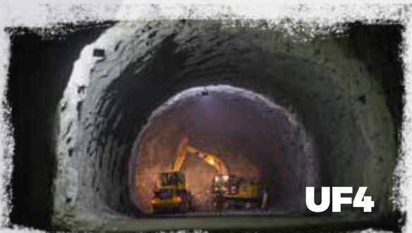
Portal Salida Túnel Irra