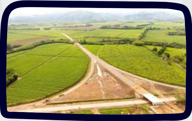
VARIANTE LA VIRGINIA