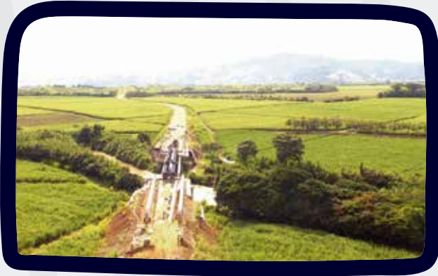
PUENTE SOBRE EL RÍO RISARALDA