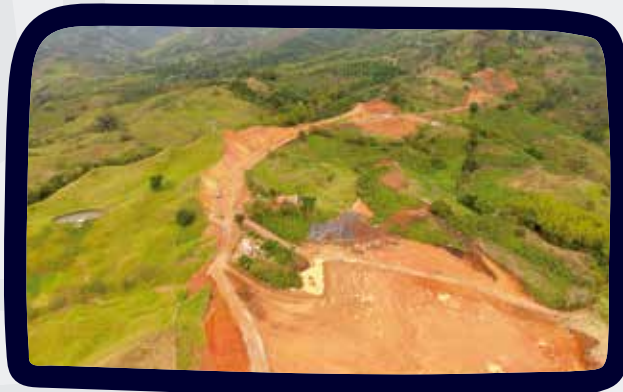
PORTAL ENTRADA TÚNEL SECTOR EL CAIRO