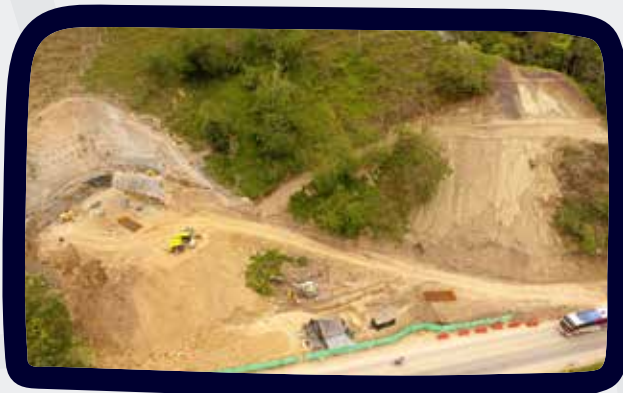
PORTAL SALIDA TÚNEL IRRA