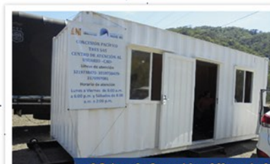
Oficina de Atención al Usuario Móvil Estación de servicio Terpel El Playón - La Felisa

La gestión social en la Concesión Pacífico Tres se enmarca dentro del proceso de mejoramiento continuo de las relaciones entre la Concesión y la Comunidad.