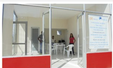
Oficina de Atención al Usuario Fija La Virginia